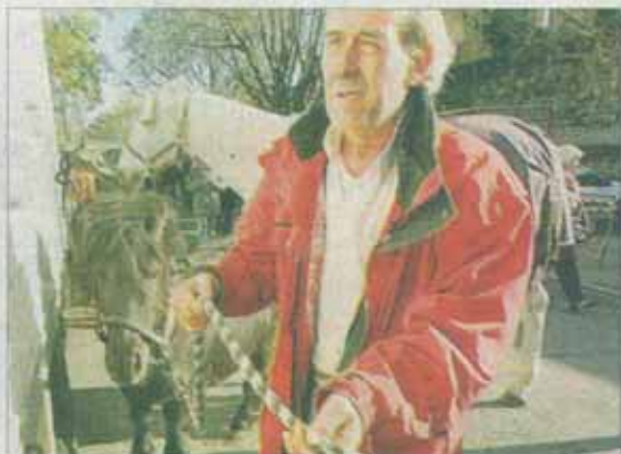
Le marché aux chevaux (une trentaine hier) est un vestige de la foire d'il y a 500 ans. Cette année porte St-Michel, il est passé par les Carmes et Pie.