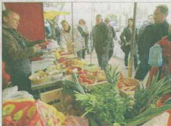
Comme ce vendeur d'ustensiles de cuisine dans la rue du 7 e Génie, la démonstration en public est l'une des particularités de la foire ancestrale.