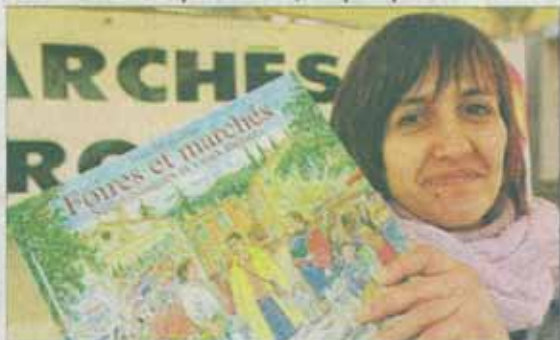
Le syndicat des commerçants non sédentaires et le comité de promotion vendent ce livre retraçant l'histoire des marchés illustré par Jean Marcellin